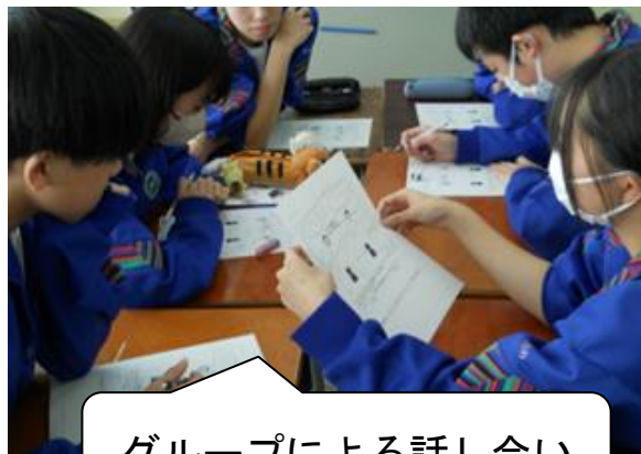
グループによる話し合い