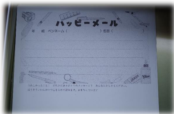
放送委員会のハッピーメール