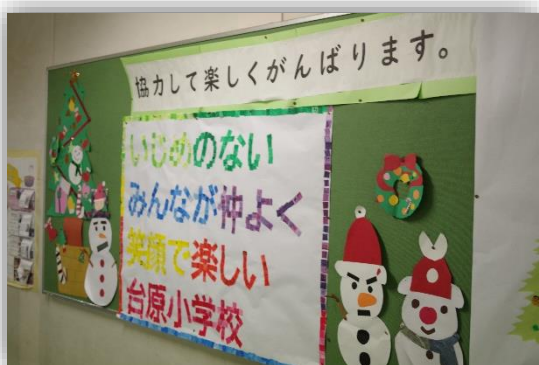
掲示委員会と全校児童で作った児童会目標