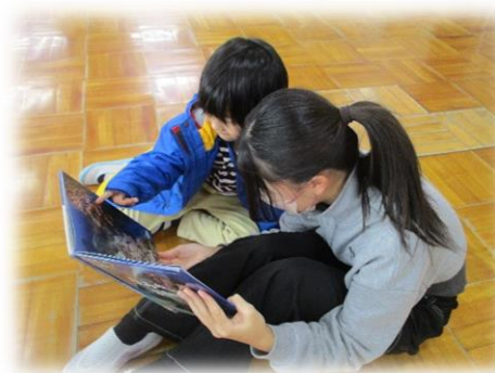
6年生による絵本の読み聞かせ

台小スマイルキャンペーンでは、児童会の各委員会がそれぞれ企画を考えました。「ハッピーメール」や「図書郵便」の取組では、友達への感謝の気持ちなどを直接言葉ににくい子供たちも、積極的に手紙を利用していました。学校中が「ありがとう」の言葉であふれました。掲示委員会の掲示物も、全校児童が参加して作成されました。学校全体がつながりを実感し、いじめの未然防止につながる関係性を築く取組となりました。